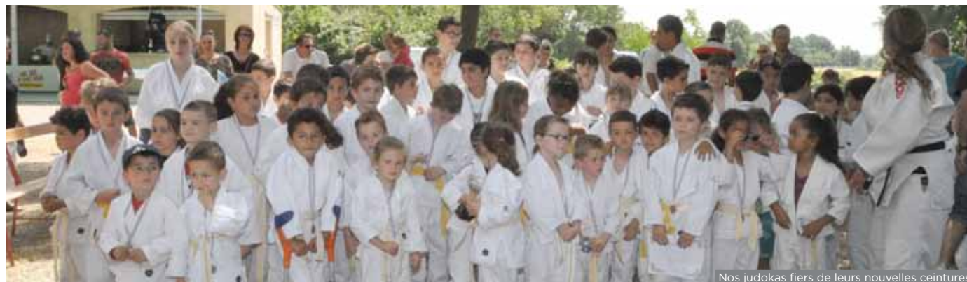
Nos judokas fiers de leurs nouvelles ceintures

La saison 2013/2014 s'est clôturée, le dimanche 08 juin 2014, aux platanettes, par la traditionnelle journée de convivialité du Judo Club de Milhaud.