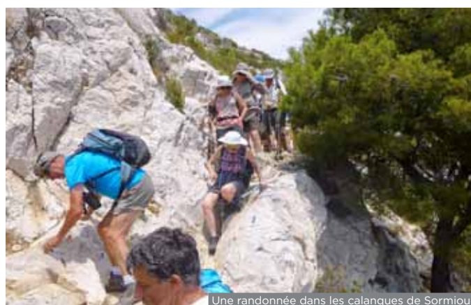
Une randonnée dans les calanques de Sormiou